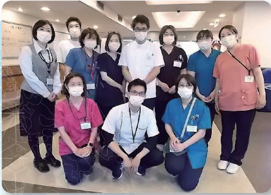
外来スタッフ一同